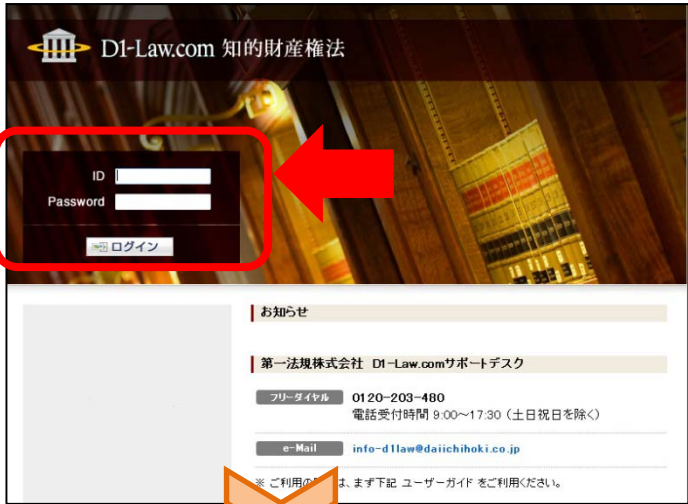
① D1-Law.com知的財産権法 トップ画面

URLが https://www.d1-law.com/chizai/ に変更になります。